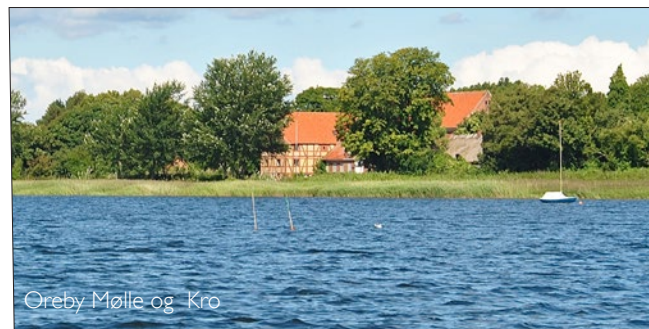
Oreby Mølle og Kro